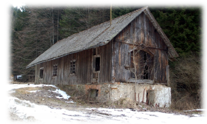
Thurnova žaga s polnojarmenikom