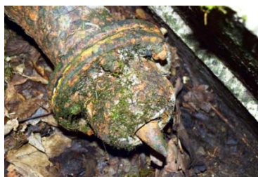
Zaključek cevi s šobo