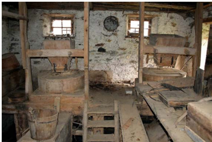
Hrvači mlin na Hudinji: dvoje koles, dva mlina

Ko danes razmišljam, zakaj je pri nas včasih obstajalo tolikšno število mlinov, saj je vsaka srednje velika domačija imela svoj mlin, ne morem prezreti, da je bilo žito takrat zelo cenjeno. Tudi odnos človeka do vsakega žitnega zrna je bil spoštljiv. Že na njivi so za žanjicami pobrali sleherni odlomljen klas in priložili h kopicam, kjer se je žito sušilo. Hoja po snopih na njivi ni bila dovoljena in jo je gospodar kaznoval, Vsako drobtinico kruha, ki je padla na tla, so pobrali, poljubili in pojedli. Torej veliko spoštovanje do žita in izdelkov iz njih.