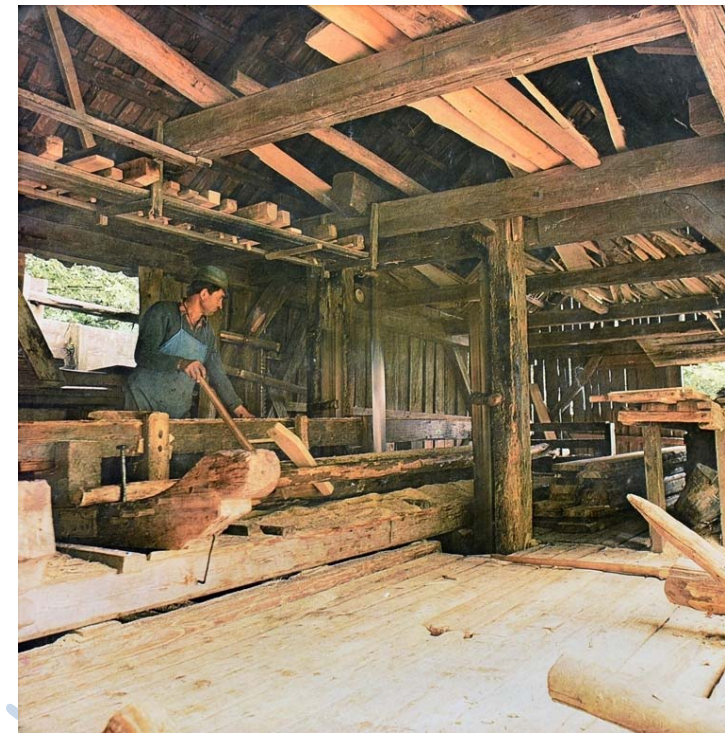
Krenkarjeva žaga nekoč

Z elektrifikacijo podeželja so žage in mline na vodni pogon opuščali in jih pričeli razvijati pri domovih.