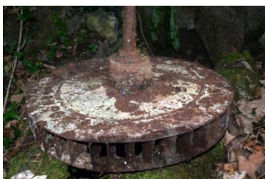
Turbina Župančeve elektrarne - mlina

Priloga glasilu VITANJČAN številka 58, 2017