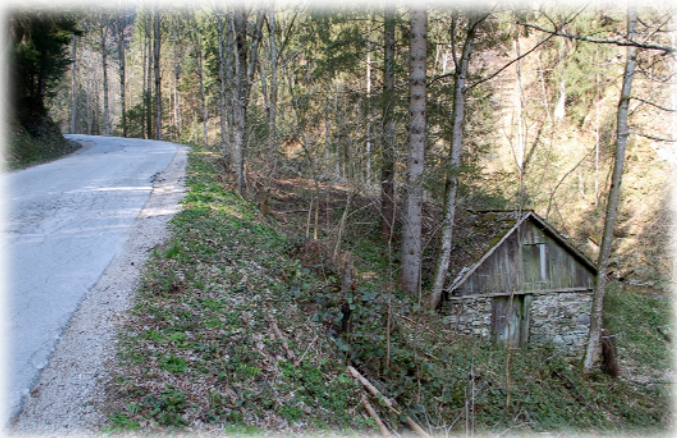
Poharnikova žaga in mlin

Avtarjev mlin, Tašičeva, Ahrnikova žaga in mlin, Štokarjev mlin, Završnikova in Ubožnega Mrzdovnika, Svarovšekov mlin, Hrvačev in Zg.Kuzmanova in Tischlerjeva žaga in kovačija, Kušarjev mlin,