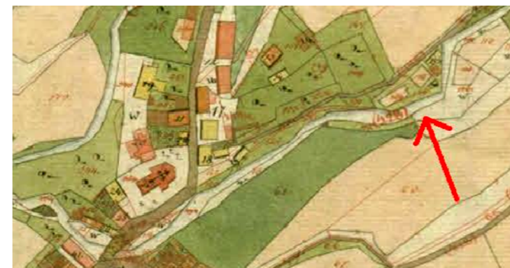
Vitanje vas leta 1825, označeni leseni objekti so žage oz. mlini na Hudinji (Franciscejski kataster)

Urbar – popis oddanih fevdov vitanjskega zemljiškega gospostva iz leta 1404 na skoraj 50 straneh opisuje obveznosti 227 družin, od tega 43 v trgu, 17 v vasi Vitanje in 167 družin v vitanjski okolici. Na straneh 43' pa do 45 so popisani tržani, ki so živeli v glavnem od obrti in drugih nekmečkih del: trgovci, tkalci, krojači, kožarji, čevljarji in mesarji. V trgu in na vasi Vitanje je popis stop, mlinov in opuščeni mlinov . Dajatve za mlin in mlinarje so bile sorazmerno visoke. Znašale so od 60 srebrnikov pa do ene marke