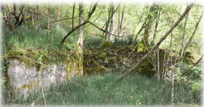
Lindauerjeva žaga I., pri Germaneku